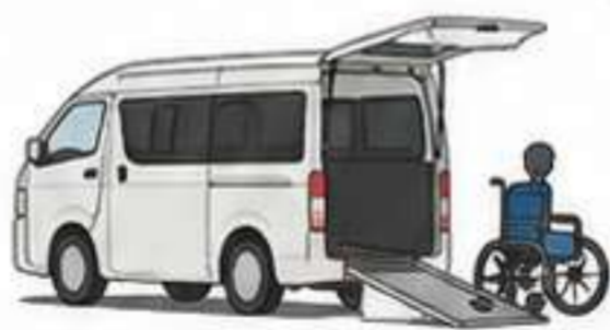
福祉車両 (8ナンバー等)